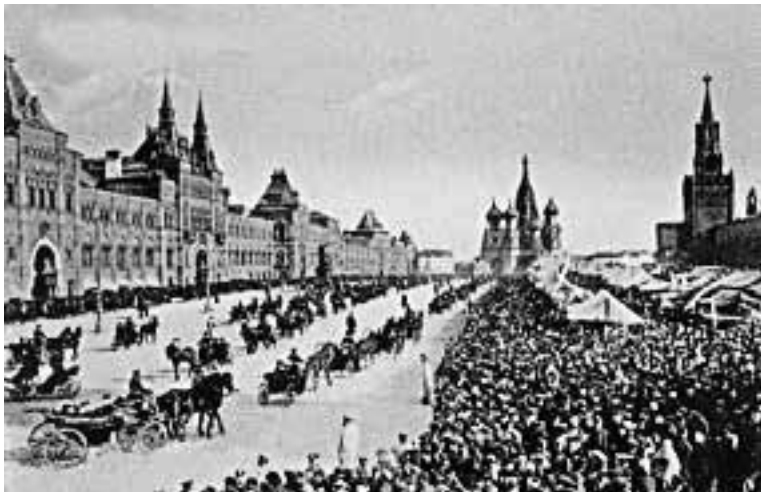
Красная площадь. Конец XIX в.

С постройкой Китай-города площадь вошла в его состав, а в 1530-х годах на ней соорудили Лобное место (лоб – край обрыва, которым кончалась площадь со стороны Москвы-реки). На Лобном месте объявлялись правительственные указы, обращались с речами к народу цари и патриархи, происходили богослужения. Следующими стали появляться на Лбу, или на Взлобье, деревянные церкви, которые ставились во время похода Ивана Грозного на Казань в память одержанных побед. Когда поход завершился присоединением Казани к Московскому государству, Иван Грозный приказал объединить все «походные» деревянные церкви в один ка-