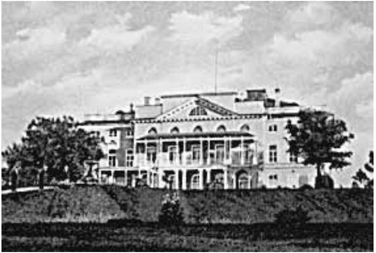
Нескучный сад. Дворец. Начало XX в.

А вот огромных рубленых домов археологи не обнаружили. Нигде. В Китай-городе, например, существовал стандарт – четыре на четыре метра, в Зарядье и вовсе четыре на три. И это при том, что в каждом доме имелась занимавшая около четырех квадратных метров большая русская печь – пережить без нее зиму семье не представлялось возможным. Далеким воспоминанием остались московские дома начала XVI столетия. Тогда они, случалось, рубились и по тридцать квадратных метров с такой же почти по площади пристройкой для скота. Средневековый город теснился все больше и