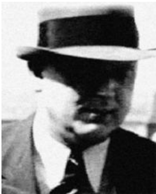
Охранник возле Евы Браун – «Виппер» – «Раттенхубер»

Но под фотографией в Интернете была подпись: «Ганс Раттенхубер... группенфюрер СС и генерал-лейтенант полиции (24.2.1945), начальник личной охраны Гитлера». Мало того, что таким образом обнаружен двенадцатый человек из самого близкого окружения фюрера, побывавший в августе 1939-го в Москве, но к тому же он начальник его личной охраны, а еще и его бессменный телохранитель, который