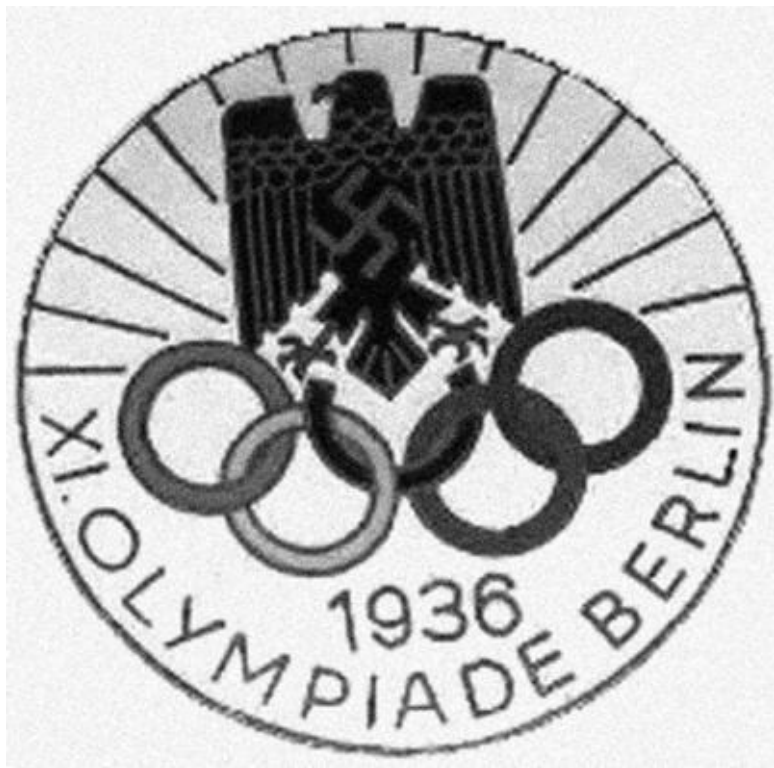
Эмблема берлинской Олимпиады 1936 г.