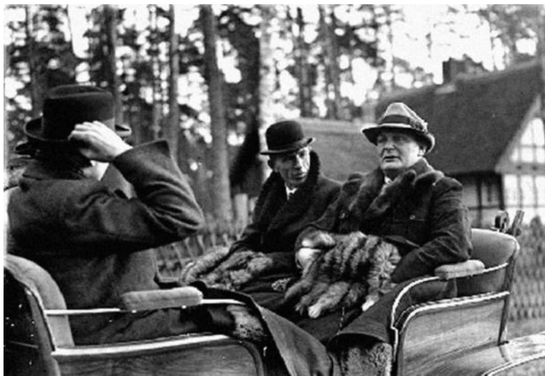
Лорд Галифакс на прогулке с Герингом

лине. В Лондоне же между премьером и министром иностранных дел Иденом проявились жесткие разногласия по австрийской проблеме, и Иден был вынужден уйти в отставку. Его заменил лорд Галифакс. 13 марта 1938 г. немецкие войска вступили в Австрию. 10 апреля 1938 г. одновременно в Австрии и Германии был проведен плебисцит, на котором 99 % проголосовало за аншлюс.