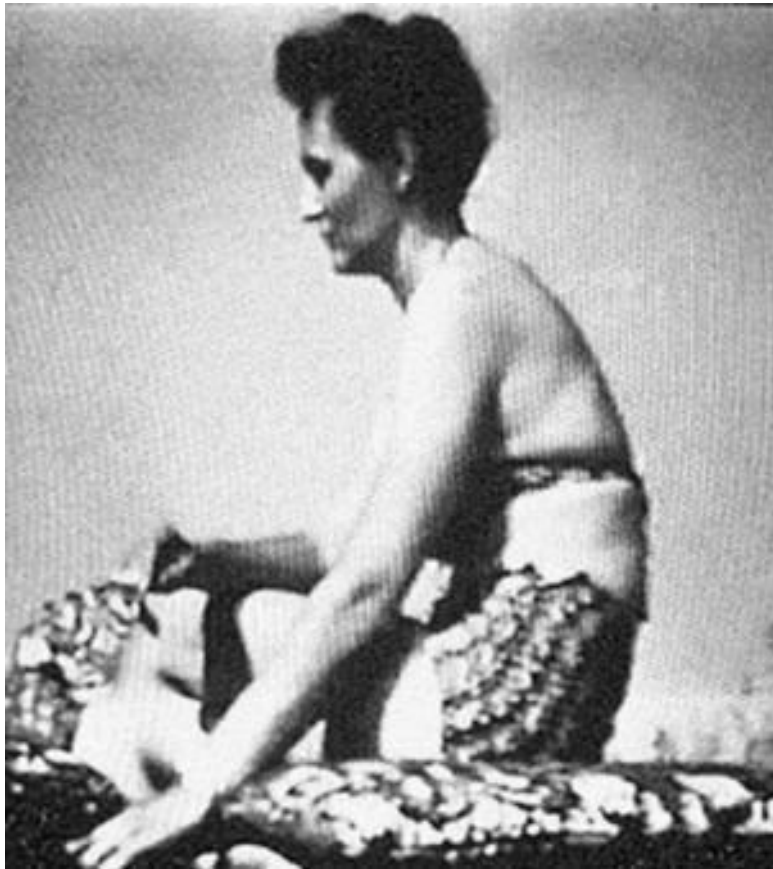
Ильзе Браун – сестра Евы Браун