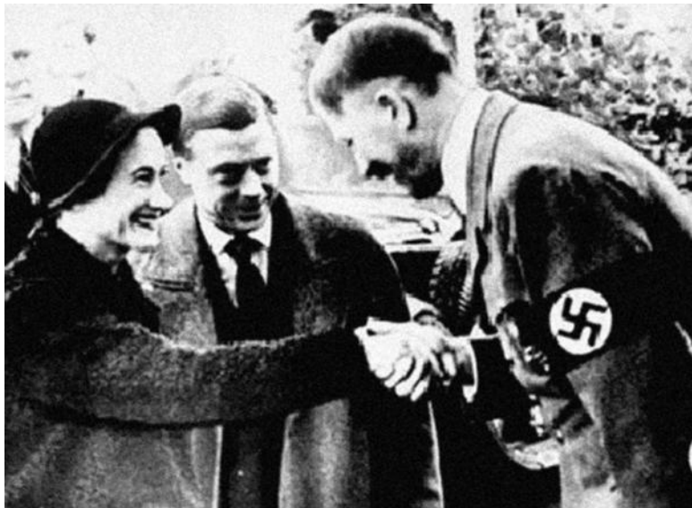
Герцог и герцогиня Виндзорские на приеме у Гитлера в Бергхофе

Возможно, поводом для этого послужила известная в те годы неприязнь Эдуарда к Черчиллю. В любом случае приведенные выше факты близкого общения Гитлера с представителями англосаксонского истеблишмента показывают, что мое предположение об англосаксонской «версальской мине», заложенной с целью привести Германию к войне против СССР и в итоге приведшей ко Второй мировой войне, не лишено оснований. Эта цепочка «неофициальных» общений с Гитлером, преимущественно английских, ясно показывает: