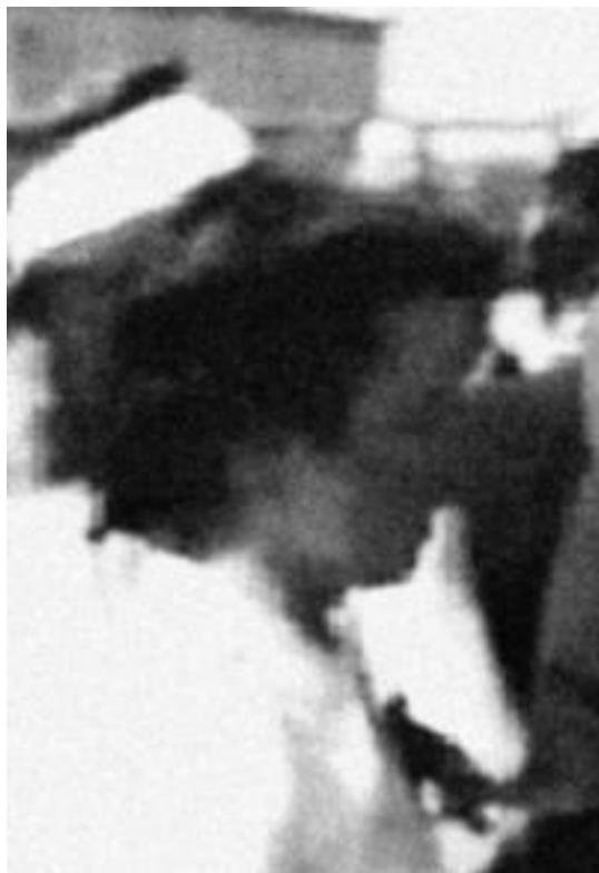
«Гильда фон Зееф» – фрагмент кинокадра, снятого в Москве