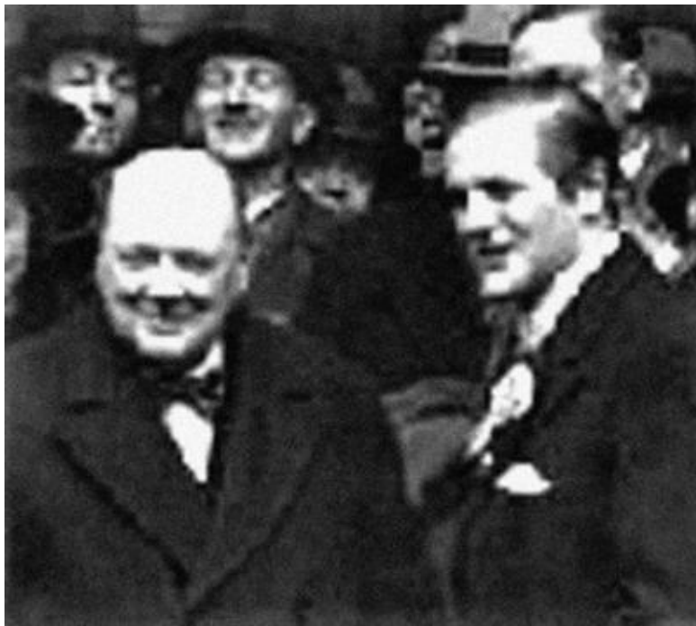
У. Черчилль с сыном Рандолфом