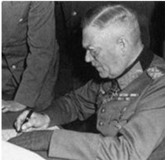
В. Кейтель, 8 мая 1945 г.